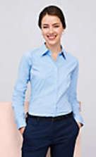
SOL'S EDEN 17015