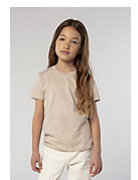
SOL'S CRUSADER KIDS 03580